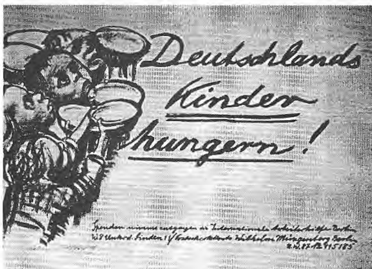
کودکان آلمان گرسنه اند

مرگ «پیتر» وظیفه مهمی را در برابر «کاته» قرار داد. وی مبارزه خود علیه جنگ را با شعار «صلح، فقط صلح، جنگ کافی است!» شروع کرد. از نمونه کارهای وی در این دوران می توان از مجسمه تراشیده از چوب به نام «زندگی مرگ: یادبود ژانویه ۱۹۱۹» نام برد. از سال ۱۹۲۰، «کاته» فعالیت ضدجنگ و انساندوستانه خود را با کشیدن پوسترهایی در این باره آغاز کرد. تابلوی «مادران»، برای فدراسیون بین المللی سندیکاها در آمستردام، و «وین می میرد! کودکان را نجات دهید»، که قحطی وحشتناک پس از جنگ را در وین نشان می دهد، از نمونه های زیبای کارهای ضدجنگ وی هستند. از دیگر آثار او در این دوران می توان از ۷ مجسمه تراشیده از چوب، با نام های «قربانی»، «داوطلب»، «والدین»، «بیوه» (شماره ۱)، «بیوه» (شماره ۲)، «مادران» و «مردم» یاد کرد.