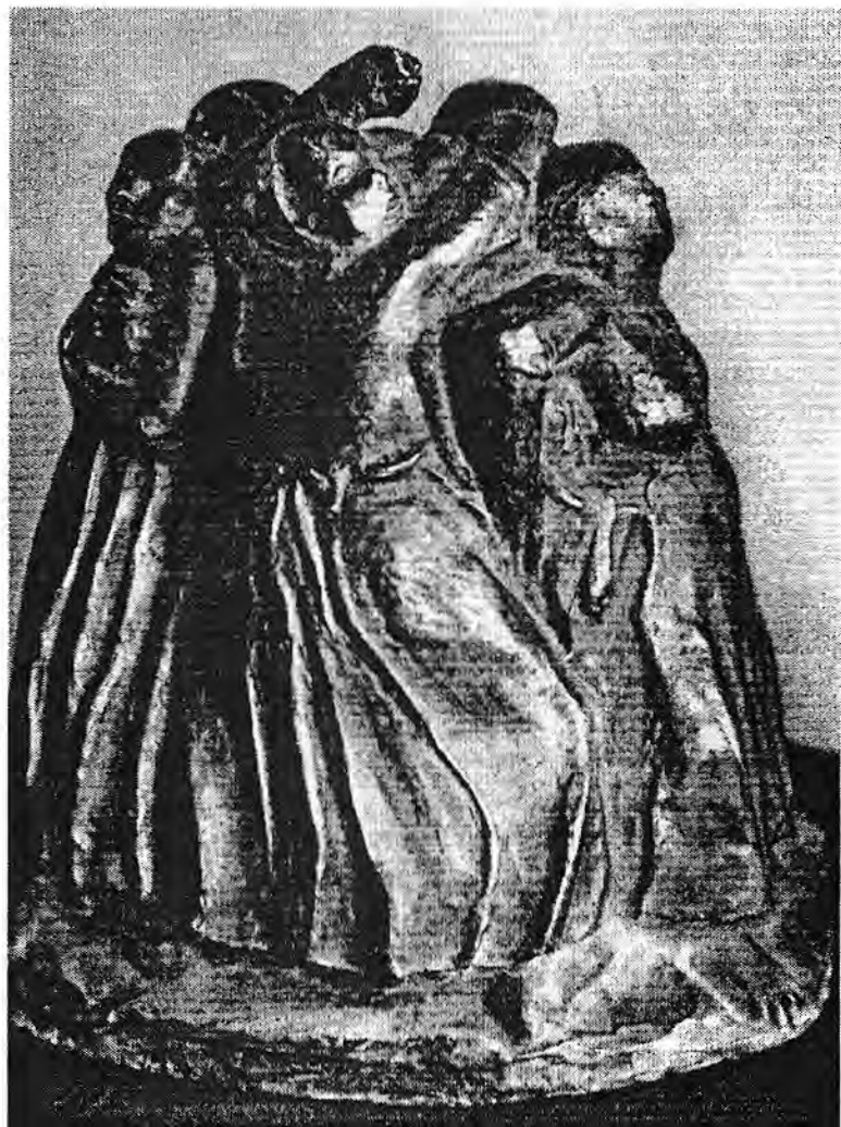
پلج مادران، ۱۹۳۷