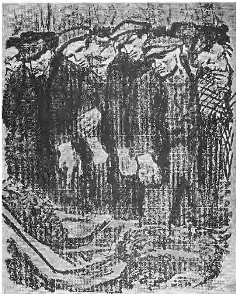
«مزار قربانیان انقلاب ۱۸۴۸» (گورستان مارس)، ۱۹۱۳