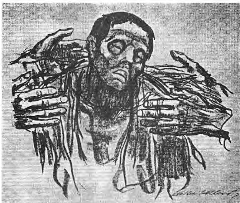
به روسیه کمک کنید، ۱۹۲۱

در سال ۱۹۲۱، جمهوری جوان شوروی با کم آبی وحشتناک «ولگا» روبرو شد و بدین مناسبت لنین طی پیامی از تمام مردم مترقی جهان درخواست همبستگی کرد. «کمیته بین المللی کمک رسانی»، که علاوه بر «کاته» افراد سرشناس دیگری چون ماکسیم گورکی، آنا تول فرانس و بسیاری دیگر عضو آن بودند، تشکیل شد. «کاته»، پوستر تکان دهنده «به روسیه کمک کنید» را به همین مناسبت طراحی کرد.